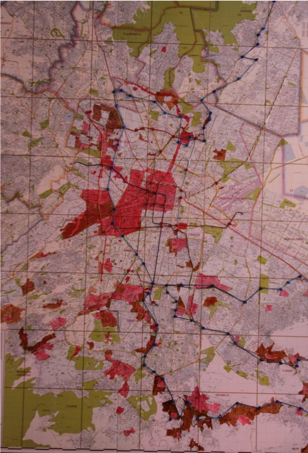
Elaboración (casa y ciudad)